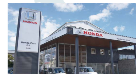
Honda Cars 広島 大州店