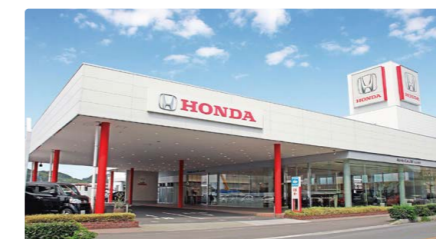
Honda Cars 愛媛 松山空港通店