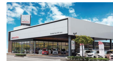
Honda Cars 香川 丸亀北店