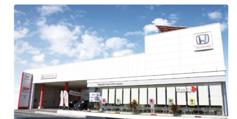
Honda Cars 山口 宇部厚南店