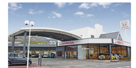
Honda Cars 高知 一宮店